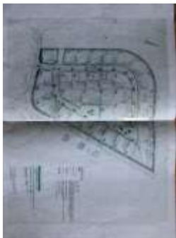
Beplantningsplan Grundejerforening Degnebakken.jpg 617K